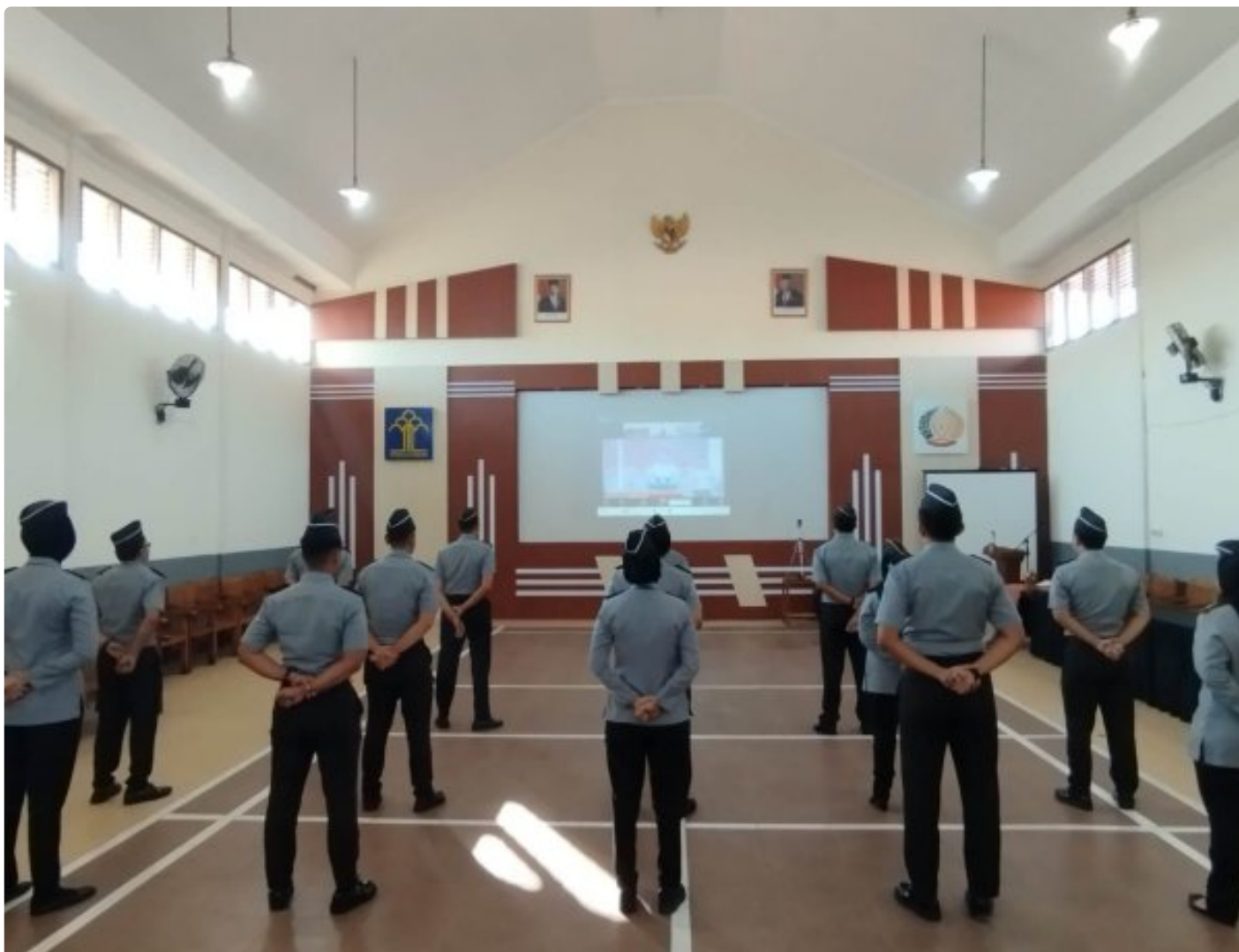
Rutan Blora Ikuti Apel Pagi Perdana Menkumham RI secara Virtual

Blora - Rumah Tahanan Negara (Rutan) Kelas IIB Blora mengikuti kegiatan Zoom Apel Perdana Menteri Hukum dan Hak Asasi Manusia Republik Indonesia, Supratman Andi Agtas. Kegiatan ini diikuti dengan penuh semangat oleh Kepala Rutan, pejabat struktural, dan seluruh pegawai Rutan Kelas IIB Blora, menunjukkan komitmen dan kesiapan mereka dalam menjalankan tugas. Senin